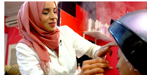
Une propriétaire de salon de coiffure et de beauté en Tunisie ayant reçu un prêt de la BERD

Environ 10% seulement des investissements des banques locales vont aux PME