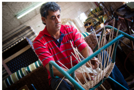
Propriétaire d'entreprise de meubles en Jordanie ayant reçu un prêt de KfW

ENSEMBLE NOUS POUVONS DÉVELOPPER VOTRE ENTREPRISE