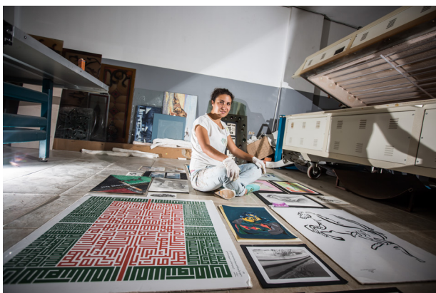
Une graphiste et artiste verrier au Liban ayant reçu un prêt de KfW

L'Initiative de l'UE pour l'Inclusion Financière a été créée en 2016 pour faciliter et élargir l'accès aux financements pour les MPME et les start-ups innovantes dans les pays du Sud: Algérie, Égypte, Jordanie, Liban, Maroc, Palestine, Tunisie. L'Initiative de l'UE pour l'Inclusion Financière comprend cinq programmes individuels mais complémentaires, gérés en partenariat avec quatre institutions financières européennes clés: KfW; Banque Européenne pour la Reconstruction et le Développement (BERD); Banque Européenne d'Investissement (BEI); Agence Française de Développement (AFD).