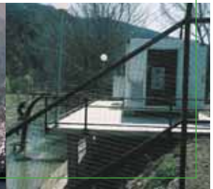
Еколошки пројекат на реци Вардар, април 2003.

Средствима Европске уније у износу од 1,7 милиона евра, постављене су две станице за аутоматско надгледање и проверу квалитета воде. Ова постројења дају благовремене информације о свему, од водостаја, температуре, киселости, до присуства нитрита, нитрата и тешких ковина. У Метеоролошкој канцеларији у Скопљу ови подаци се стално надгледају.