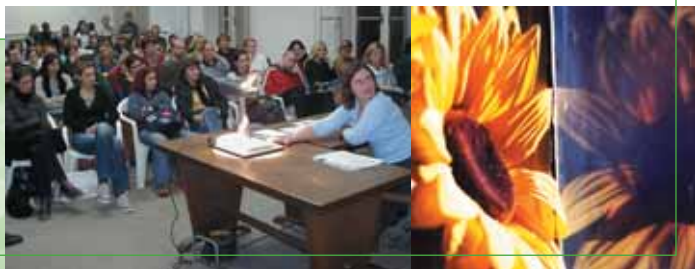
Семинар пројекта "Зелена акција", Хрватска, мај 2003.

Укљученост јавности у питања очувања и заштите природне околине у Хрватској је још увек веома ограничена, а постоји неколико успостављених канала посредством којих грађани могу да сазнају како се решавају питања природне околине или на који начин могу да учину на доношење закона о заштити природне околине у земљи.