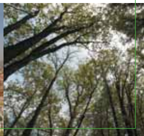
Излетишта у околини Сарајева, 2003.